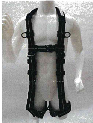
フルハーネス全体（前側）