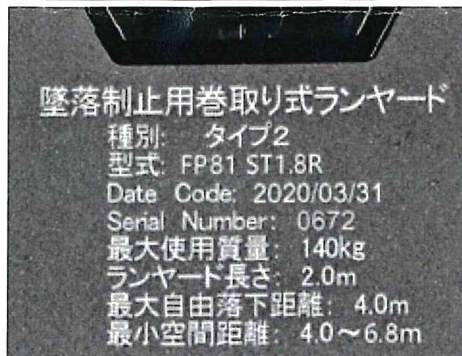
ショックアブソーバの表示