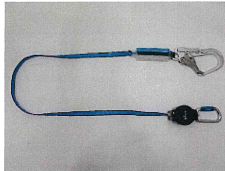
ランヤード全体 (巻取器からストラップを全て出した状態)